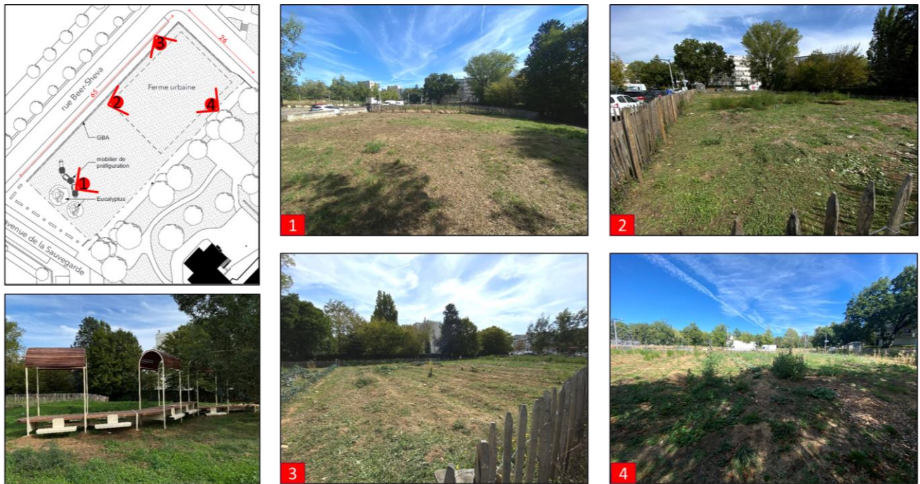
Figure 3 : Photographies du lieu avant les travaux de la Halle Agricole, septembre 2022