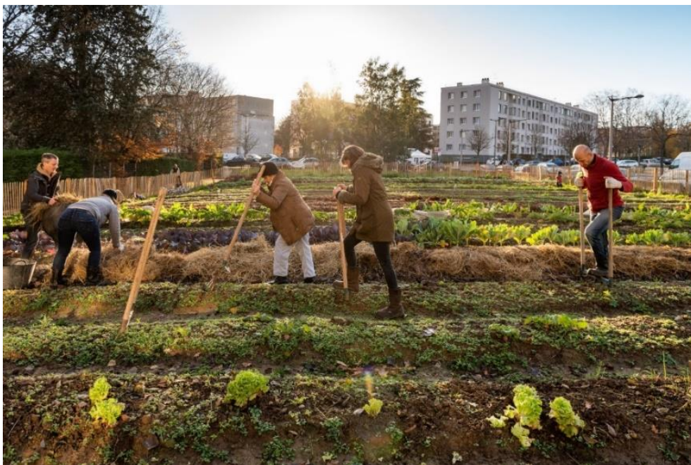
Figure 2 : Photographie de la micro-ferme urbaine de la sauvegarde, en 2021